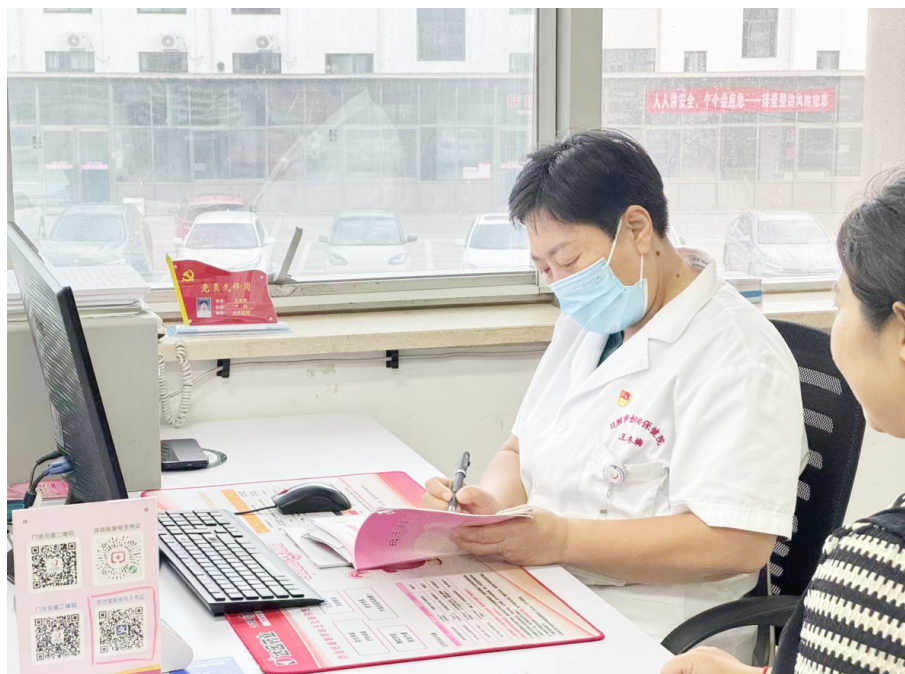
全媒体记者 田文俊

在日照市妇幼保健院产科，每一天都是新生命的序章。这里有一群步履不停的人，他们用双手托举千万家庭的希望。 作为日照市临床重点专科、市级危重孕产妇救治中心，这个拥有73人、医师19人的专业团队，正在书写着关于专业、关于温度、关于传承的故事。