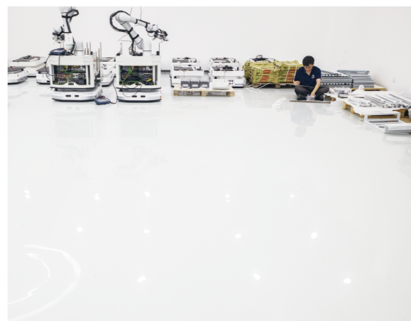
在南科佳安做机器人