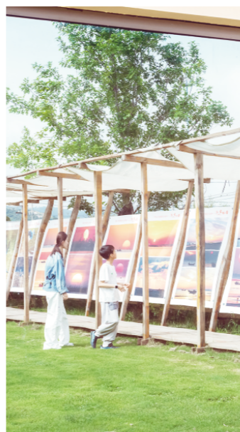
◀一个关于「日出初光先照」的摄影展