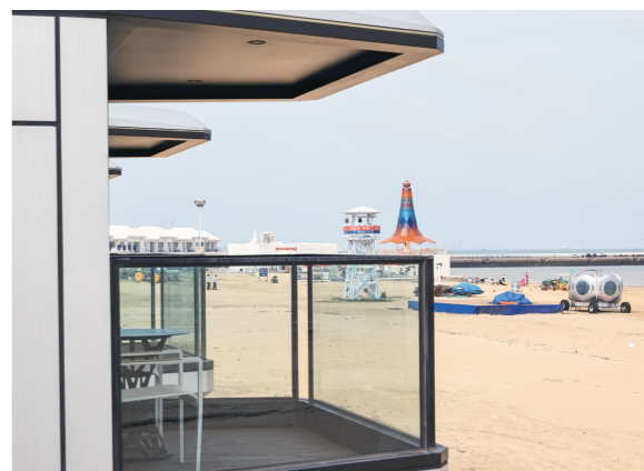
从岸上的“诺亚方舟”看海