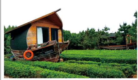
废旧渔船改造的船坞民宿保留海洋记忆。