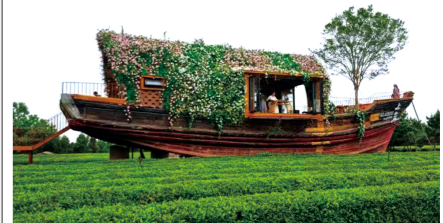
在茶香与海浪声里,游客在此尽享山海间惬意的艺术慢生活。

5月22日,游客在山东省日照市山海天旅游度假区云过山丘茶旅园“上岸”茶咖品一杯“听海长大的茶”,看窗外茶田连绵;漫步百亩茶园,采摘一把新茶;夜宿船坞民宿,伴着老船的海洋味道入睡。采茶品茗,枕海而居,在茶香与海浪声里,游客在此尽享山海间惬意的艺术慢生活。