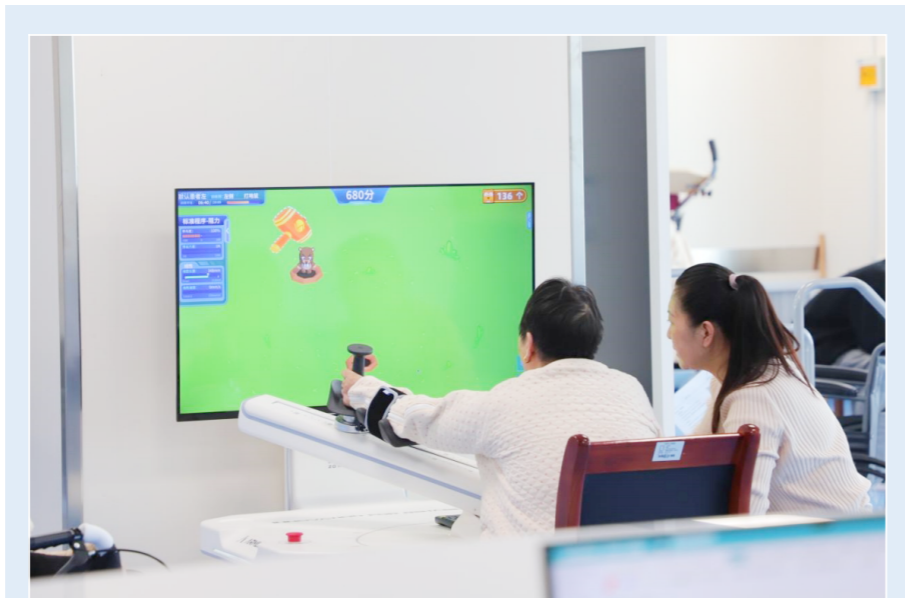
患者用上肢三维运动康复机做康复训练。