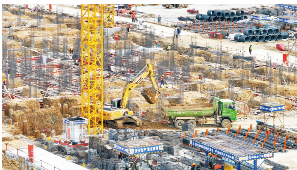
生活用纸项目二期工程项目工地,现场一派热火朝天景象。