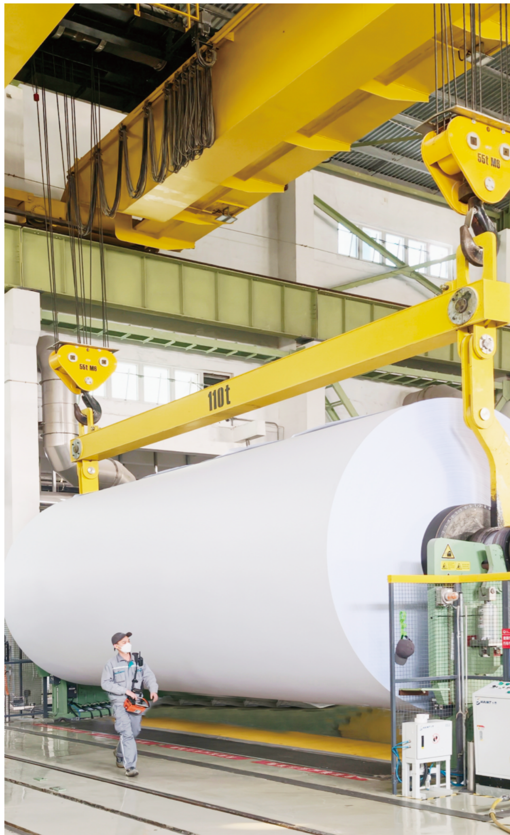
在文化纸生产线,行车操作员正在将幅宽8.7米,重60余吨的大纸卷送往复卷工序。