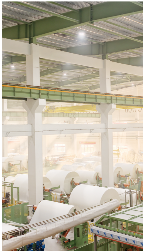
新投产的生活纸分切包装线。