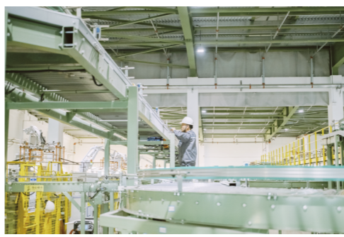
在生活纸后加工车间,工作人员在查看下线的抽纸。

未来,亚太森博将持续以扩能升级为抓手,以数智转型为引擎,在浆纸行业高质量发展赛道上稳步前行,不断为区域经济发展注入新活力。