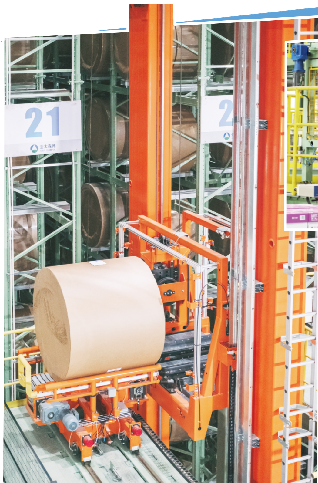
在新投产的数智化自动立体仓,设备正在进行无人化作业。