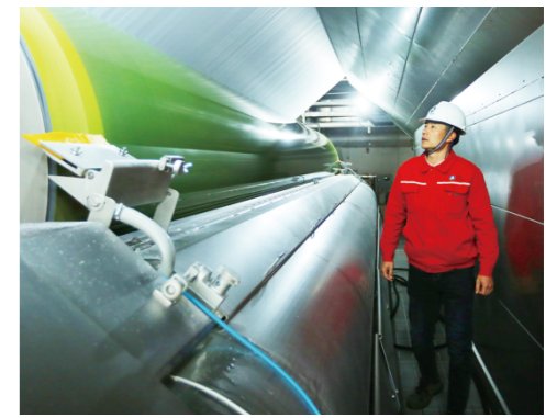
安全员正在进行安全巡查。