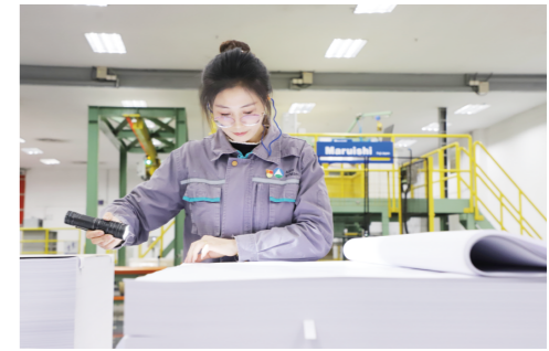
在文化纸完成部,工作人员正在对复印纸进行选理作业。