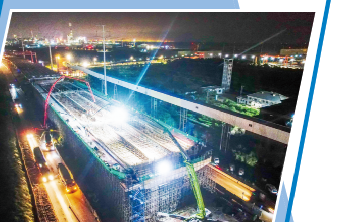
南沿海高架建设攻坚现场