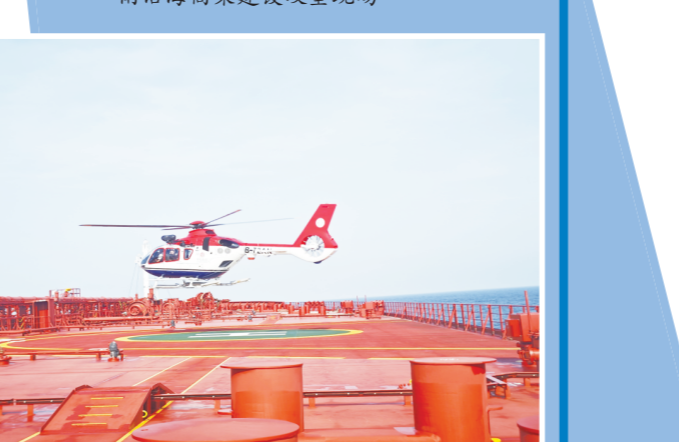
直升机引航助力港口生产