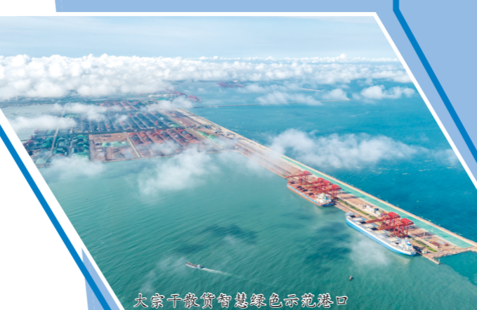
大宗干散货智慧绿色示范港园