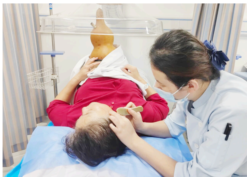
患者正在进行葫芦灸和耳部刮痧护理