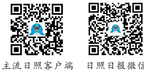
主流日照客户端 日照日报微信